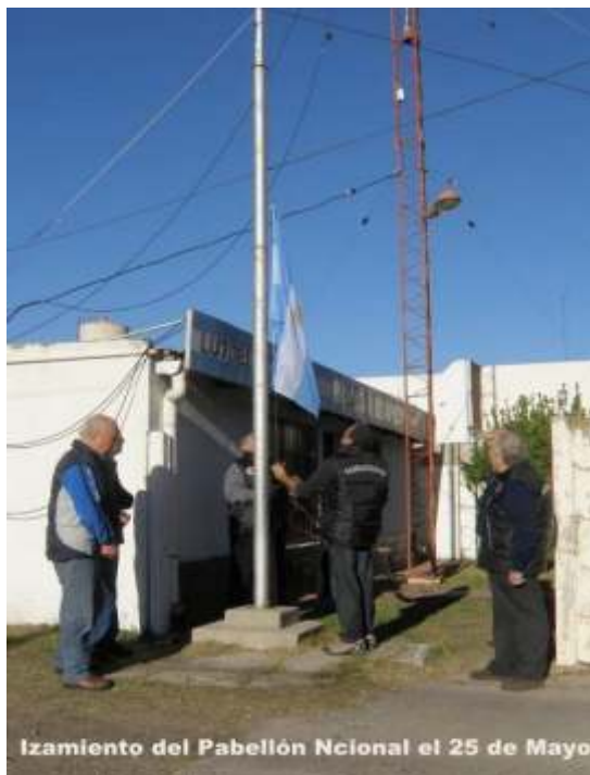
Izamiento del Pabellón Nacional el 25 de Mayo