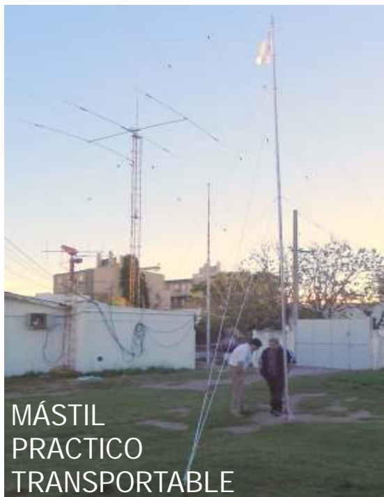
MÁSTIL PRACTICO TRANSPORTABLE